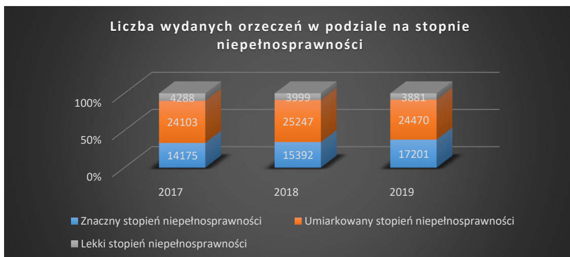
Wykres 2. Liczba orzeczeń o niepełnosprawności w podziale na stopnie niepełnosprawności

Źródło: Źródło: Opracowanie własne na podstawie danych z PUW w Gdańsku