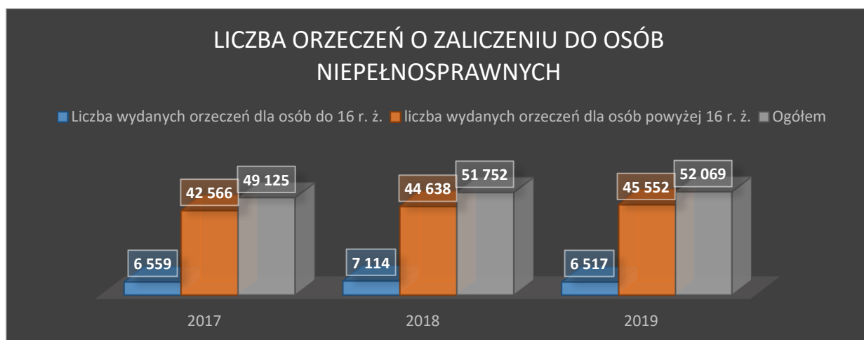
Wykres 1. Liczba orzeczeń o niepełnosprawności wydanych w województwie pomorskim