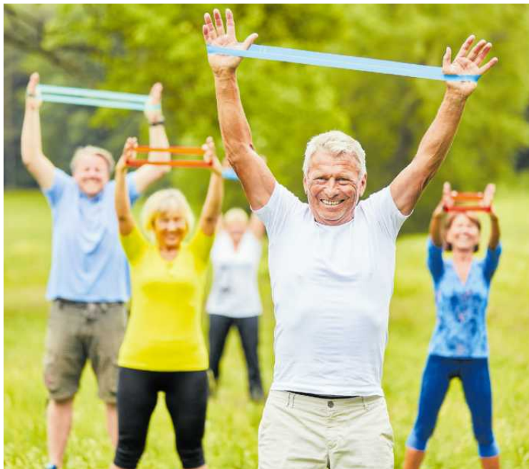
• Seniorzy mogą bezpłatnie korzystać m.in. z zajęć ruchowych

Lęborski Uniwersytet Trzeciego Wieku Adres: ul. Bolesława Krzywoustego 1, 84-300 Lębork. Kontakt: 59 843 46 08. Co proponuje UTW? Zajęcia sportowo-rekreacyjne oraz warsztaty