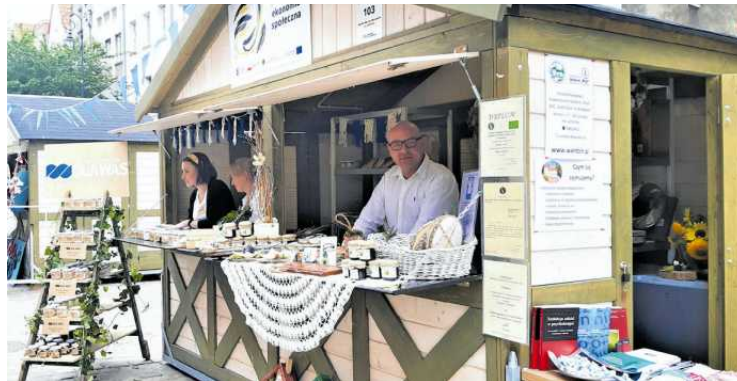
• Stoiska przedsiębiorstw społecznych z Pomorza: Fundacji dla Was z Rumi i Stowarzyszenia Solidarni „Plus” z Wandzina

Z kolei „Dobre Miejsce”, założone przez Parafię Św. Mikołaja w Gdyni, sprzedawało domowe, świeże zapiekanki z najwyższej jakości produktów, m.in. w wersji wiosennej, serowo-szpinakowej oraz mięsnej.