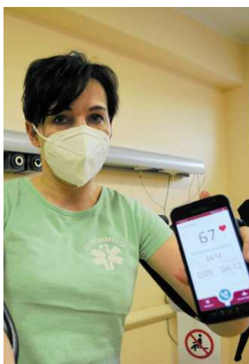
• Rehabilitację Postcovidową prowadzi m.in. Szpital w Słupsku

Pod okiem ekspertów pacjenci mogą tu skorzystać z bogatego programu zabiegów. Oddział jest w pełni przystosowany do potrzeb osób w starszym wieku z niepełnosprawnościami. W 2020 roku przeprowadzono tu generalny remont. Dzięki temu teraz posiada bardzo dobre warunki lokalowe. Dzierżąžno jest zlokalizowane blisko Trójmiasta, a kompleks lasów tworzy wyjątkowy klimat sprzyjający większej aktywności na świeżym powietrzu. Dzięki rehabilitacji seniorzy mają szansę znacznie poprawić swoją