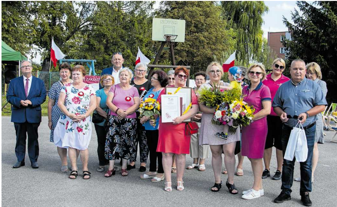
• Wręczenie nagrody „Pracodawca Przyjazny Seniorom” dla Spółdzielni Socjalnej „Sercem do Ludzi” z Dzierzgonia

Dom im. J. Korczaka zaprasza chętnych na wolontariat. To regionalna placówka opiekuńczo-terapeutyczna w Gdańsku, prowadzona przez samorząd województwa. Wolontariusze mile widziani. Zgłoś się, jeśli masz czas i chcesz zrobić coś dla innych.