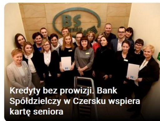
Kredyty bez prowizji. Bank Spółdzielczy w Czersku wspiera kartę seniora