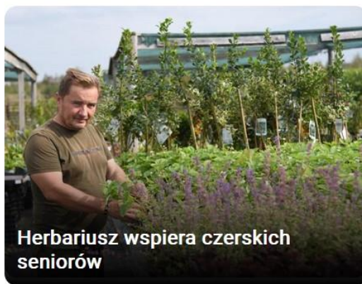
Herbariusz wspiera czerskich seniorów