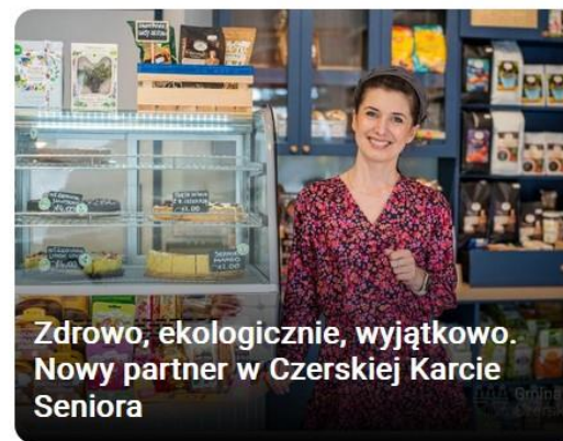
Zdrowo, ekologicznie, wyjątkowo. Nowy partner w Czerskiej Karcie Seniora