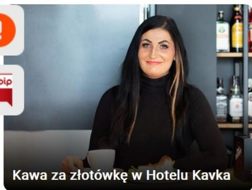
Kawa za złotówkę w Hotelu Kavka