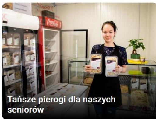
Tańsze pierogi dla naszych seniorów