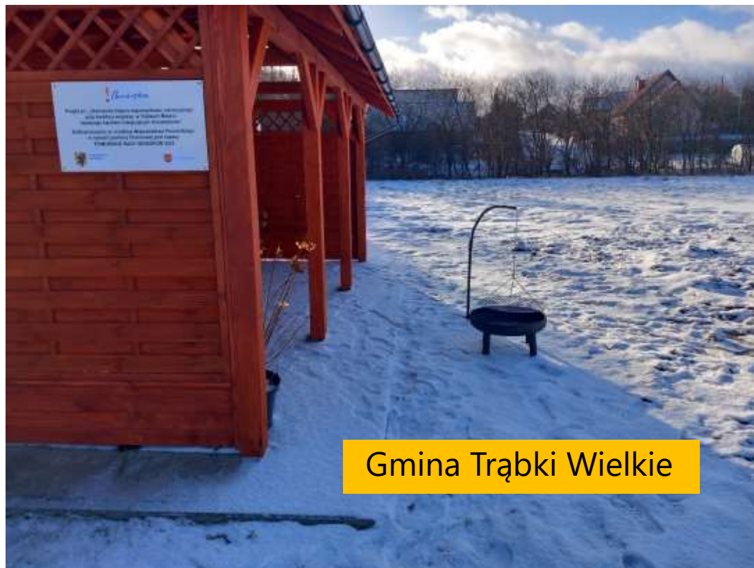
Gmina Trąbki Wielkie