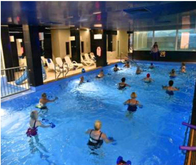
Gmina Miejska Rumia